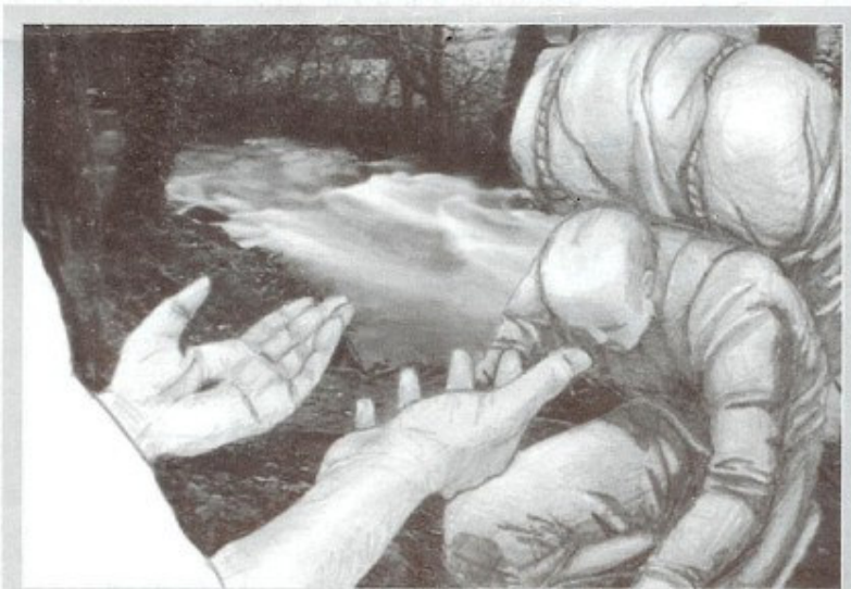
JEZUS ZEGT "KOM!" Geloof is onze beweging naar God toe. Dit betekent dat u Hem alleen kunt bereiken, ontvangen en dicht bij Hem kunt blijven door geloof (Hebreeën 10:38-39).

Mensen van geloof, JEZUS ZEGT: "KOM !" in Matteüs 11:28 , allen die arm, rijk, verloren, onderwezen, onwetend of wetend zijn. Wat de situatie ook is waar u zich in bevindt - of het nou goed of slecht is - Jezus is degene die u nodig hebt. Bent u zonder aanzien in de maatschappij? Arme herders kwamen bij Jezus en vonden vreugde die door niets verwoest kon worden ( Lukas 2:15-20 ). Bent u verdwaald en voelt u zich ver bij Hem vandaan? Tvenaars uit het Oosten kwamen bij Jezus en vonden ongewone vrede, die onderwijs en rijkdom niet konden geven ( Matteüs 2:1-11 ). De uitnodiging staat dit jaar nog steeds. JEZUS ZEGT: "KOM !" - vind rust in Mij. Ontvang Jezus dit jaar en ontvang rust ( Jesaja 61:1-11 ).